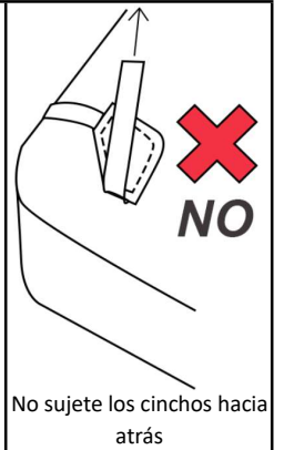
No sujete los cinchos hacia atrás