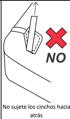
No sujete los cinchos hacia atrás